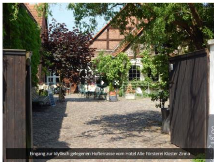
Eintritt zur idyllisch gelegenen Hofterrasse vom Hotel Alte Försterei Kloster Zinna

Ort: Alte Försterei Kloster Zinna (direkt an der Fläming Skate) 14913 Jüterbog, OT Kloster Zinna König-Friedrich-Platz 7 Tel.: 030 243596-99 / Mail: info@alte-foersterei-kloster-zinna.de