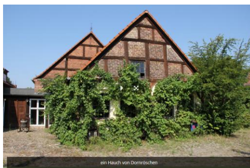
ein Hauch von Dornröschen