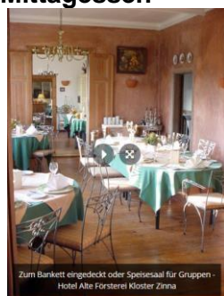
Zum Bankett eingedeckt oder Speisesaal für Gruppen - Hotel Alte Försterei Kloster Zinna